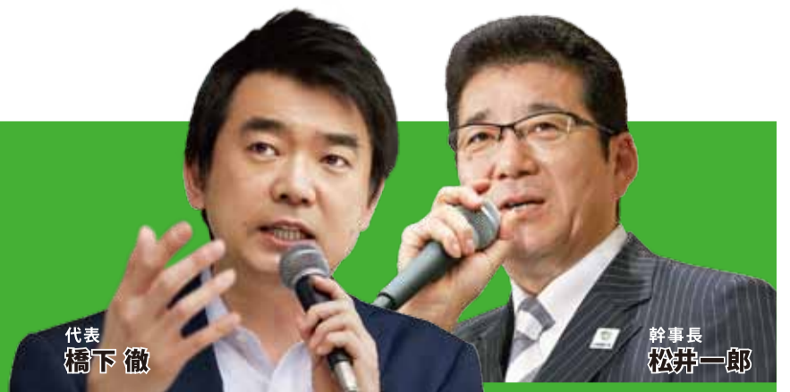
代表 橋下 徹

大阪維新の会は、府市再編であらゆるムダをなくします。そして大阪の持続的な成長に向けた、未来を見据えた施策を実現していきます。