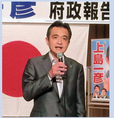
6/14 能勢町 浄るリシアター