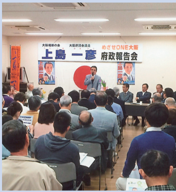
5/10 箕面市民活動センター