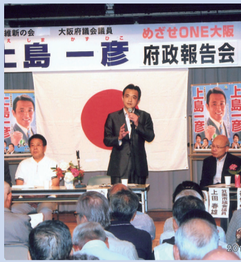
6/8 箕面市メイプルホール