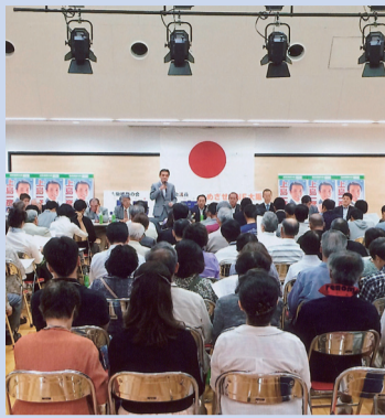
5/25 箕面市東生涯学習センター