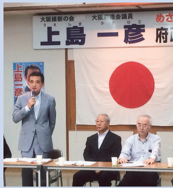
5/31 豊能町 西公民館