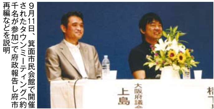
9月11日、箕面市民会館で開催されたタウンミーティング(約千名が参加)で府政報告し府市再編などを説明

編集・発行=大阪維新の会大阪府議会議員団 http://osaka-ishin.jp/ 〒540-8570 大阪市中央区大手前 2丁目1番22号(大阪府庁内) TEL (06) 6946-5390 FAX (06) 6946-5391